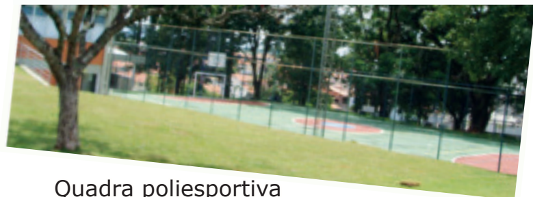
Acesso facilitado para todas as áreas