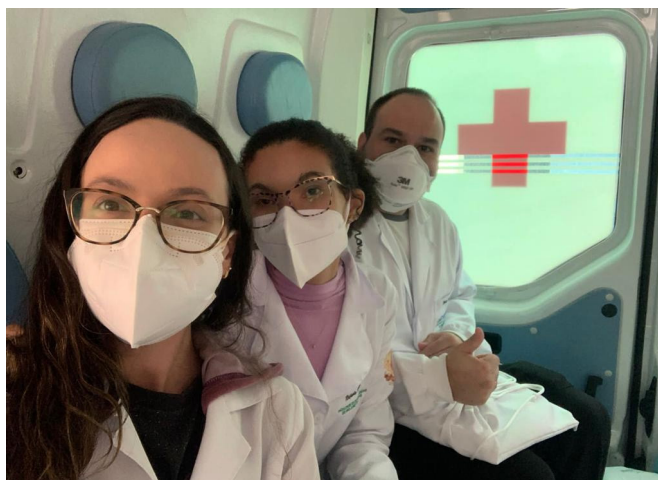
Alunos durante a prática de resgate em ambulância