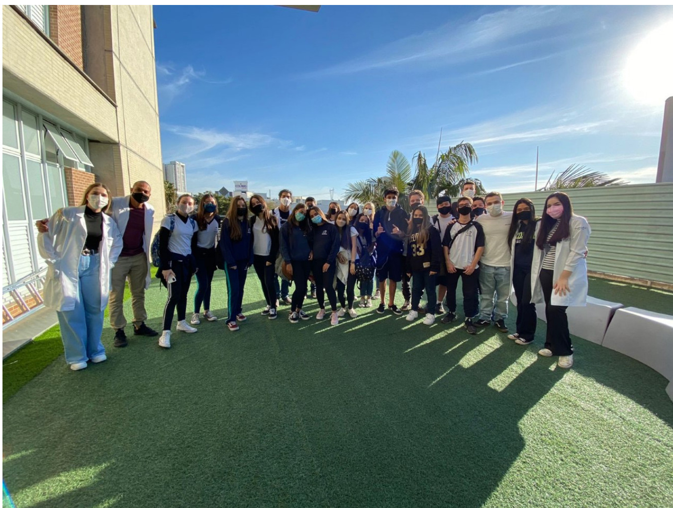
Integração alunos da Humanitas e alunos do Poliedro