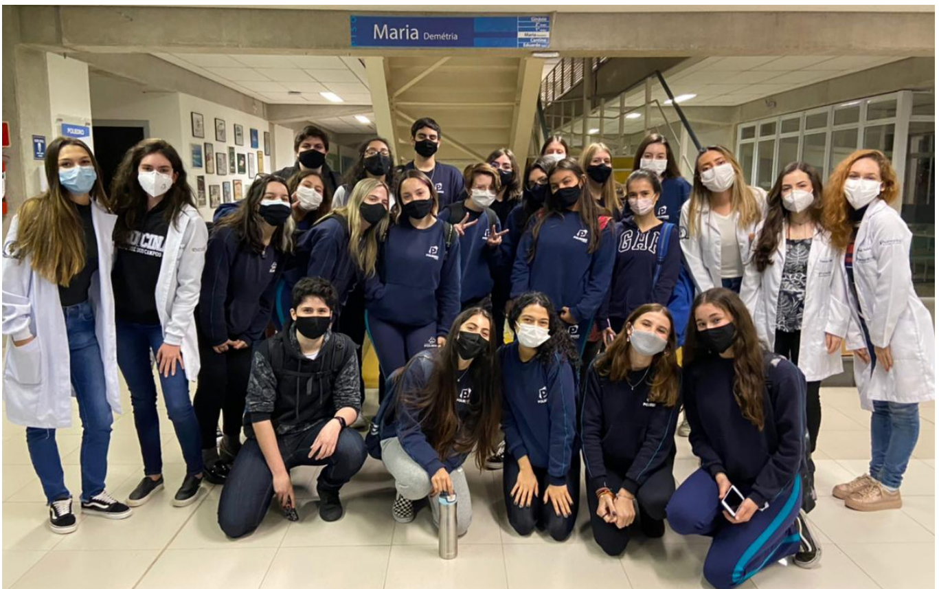
Alunos do Colégio Poliedro

Uma atividade organizada pelos próprios alunos, que no futuro irá gerar grandes frutos para a área médica.