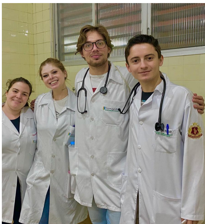
Com sensação de dever cumprido, nossos alunos botam em prática os conhecimentos adquiridos ao longo do curso