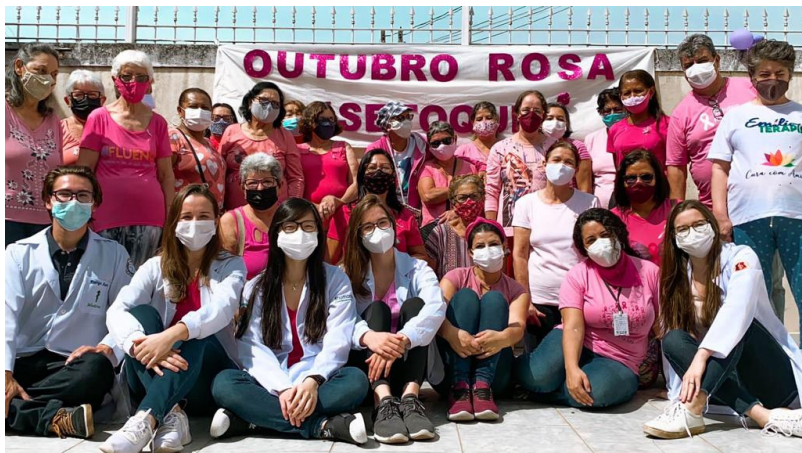
Turma reunida durante campanha do Outubro Rosa

O terceiro ciclo do Internato tem duração de seis semanas e data final marcada para o dia 3 de dezembro