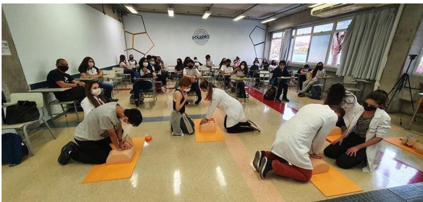
Alunos simulando primeiro socorro